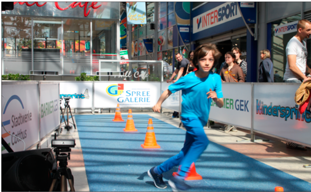
Der „Stadtwerke Kindersprint“ will Freude an der Bewegung wecken! An der Sportbetonten sowie den Grundschulen Erich Kästner, Carl Blechen und Fröbel ist das auch dieses Jahr wieder während der Vorläufe gelungen!

Auf dem rund 8,5m langen Parcours geht es für die jungen Starter nicht nur um Schnelligkeit. Hohes Reaktionsvermögen, Antrittstempo und Wendigkeit können ebenso auf der Ziellinie für den entscheidenden Zeitvorteil sorgen. Selbst vermeintlich „unsporliche“ Kids erleben bei diesem modernen Wettkampf unvergessliche Erfolge. Bundesweit stellten sich seit 2015 mehr als 150.000 Kinder mit Begeisterung dem Sprint. Cottbus als ausgezeichnete Sportstadt steht natürlich nicht abseits! „Während der Vorrunden vom 4.–12. Mai besucht der Kindersprint wieder mehrere Grundschulen der Stadt und sorgt dabei für eine besondere Sportstunde“,