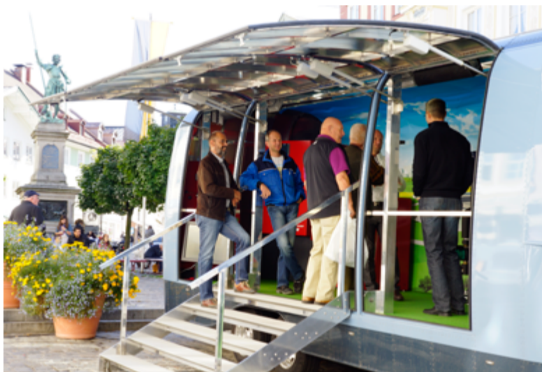
Achten Sie am 9. Mai auf diesen Truck. Hier sind alle am Thema Wärme Interessierten herzlich willkommen!