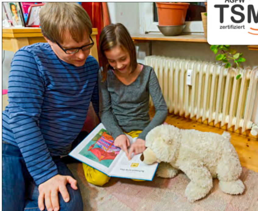
Damit es zu Hause gemütlich ist: Fernwärme von den Stadtwerken Cottbus!

„Alle Anforderungen aus dem AGFW-Arbeitsblatt FW 1000 zur Wärmeverteilung erfüllen wir ohne wenn und aber. Das Papier beschreibt die nötigen Qualifikationen