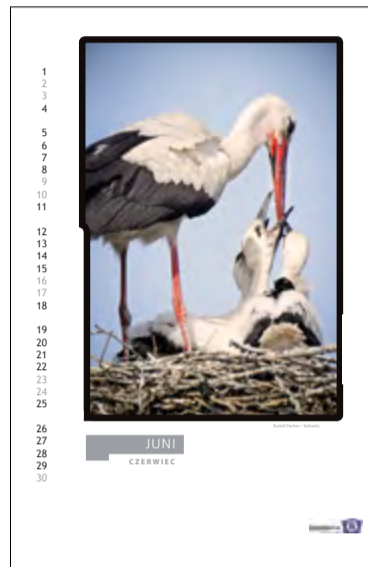
Die Bilder der Erstplatzierten als Kalenderblätter: Eindringlich zeigen sie die tierische Vielfalt in der Lausitz.

Mit dem Alltäglichen ist es schließlich so: Man bemerkt seine Schönheit irgendwann nicht mehr. Die Vögel, die über den Köpfen kreisen,