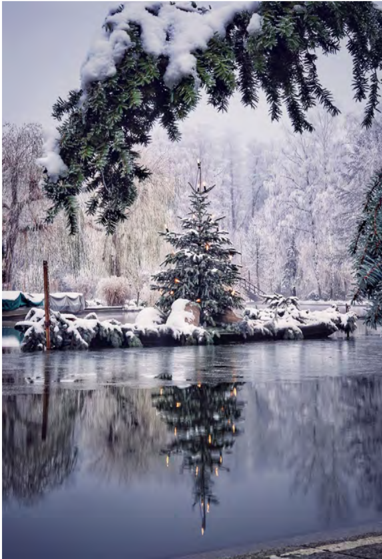
Daniel Hillebrand wurde für sein Bild einer weihnachtlichen Winterlandschaft am Wasser mit dem 1. Preis ausgezeichnet.

Fotoausstellung „Kalle 23“ versammelt wieder die schönsten Ansichten aus der Lausitz